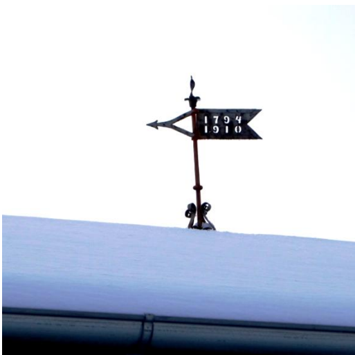
Vimpel på Ny Sonnerup gård

I Roldsteds slægtsbog nævnes det, at der i sommeren 1794 bygges en ny gård på Tuse mark, kadet Nye Sonneup, og at herskabet har tiltænkt N.R. denne. Af Løvenskiolds dagjournal fremgår dog, at N.R. først overtaget den i 1795, idet han samtidig ophører at figurere på godsets lønningsliste over tjenerskabet. Beslutningen om at overdrage gården til N.R. som fæstegård træffes dog i 1794, hvilket fremgår af oversigter over udskiftninger. Så sent som i april 1795, er han stadig tjener og sendes til Minneslyst. Han skal hente et barometer, der skal ophænges i baronens værelse. På vejen skal han Lønder bestille to nye vogne, hvoraf han selv skal have en ene til Ny Sonnerup.