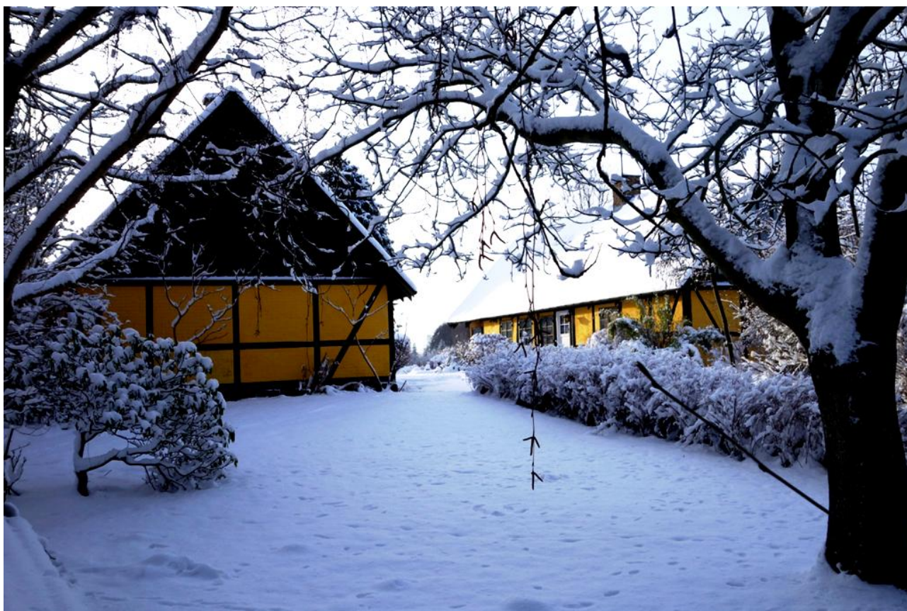
Højmandshuset i dag